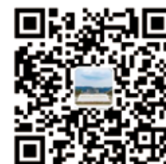
宜宾校区官方微信公众号

① 通讯地址：四川省宜宾市临港经济技术开发区大学城路三段216号（宜宾校区） ② 联系电话：0831-360 2676 / 招生咨询电话：0831-358 3587 ③ 学校官网：www.cisisu.edu.cn