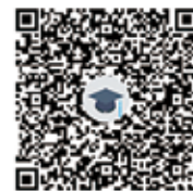
职业化培养咨询群